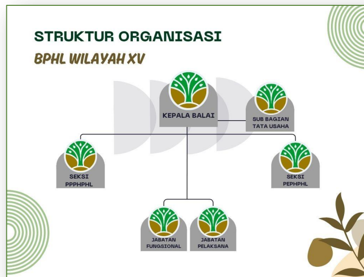
Gambar 2. Struktur Organisasi Balai Pengelolaan Hutan Lestari Wilayah XV