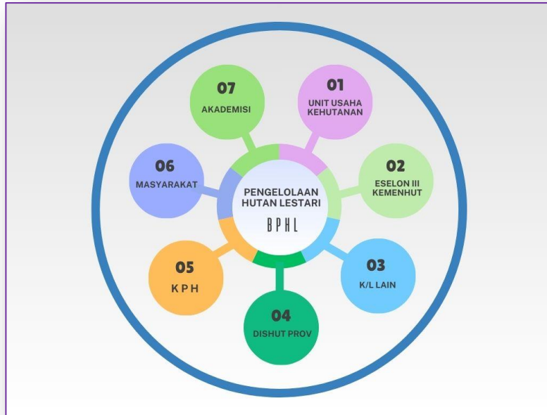
Gambar 7. Crosscutting pemangku kepentingan lingkup BPHL