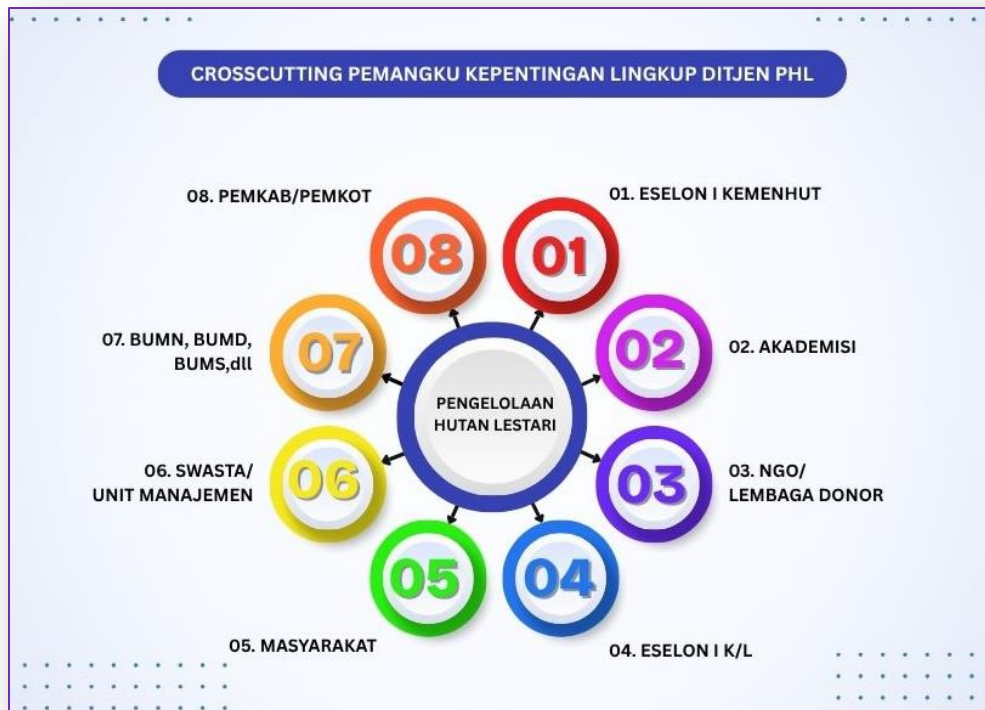
Gambar 6. Crosscutting pemangku kepentingan lingkup Ditjen PHL

Pencapaian kinerja Ditjen PHL dalam upaya pengelolaan hutan tidak lepas dari peran serta dan kerjasama berbagai pemangku kepentingan dimulai dari pemerintah pusat lintas Eselon I Kementerian Kehutanan, lintas kementerian/Lembaga, pihak swasta (unit manajemen), NGO Lembaga Donor, akademisi, sampai dengan masyarakat. Pada lingkup BPHL Wilayah XV juga terbentuk crosscutting berbagai pihak seperti Es. III lingkup Kemenhut, Kementerian/Lembaga lain, Pemerintah Provinsi (Dinas Kehutanan Provinsi dan KPH), pihak swasta, unit usaha kehutanan dan masyarakat. Gambaran crosscutting dalam lingkup Ditjen PHL dapat dilihat pada Gambar 6 dan Tabel 8 berikut.