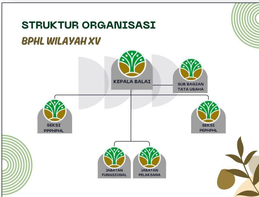
Gambar 2. Struktur Organisasi Balai Pengelolaan Hutan Lestari Wilayah XV

Adapun struktur Organisasi Balai Pengelolaan Hutan Lestari Wilayah XV adalah sebagai berikut :