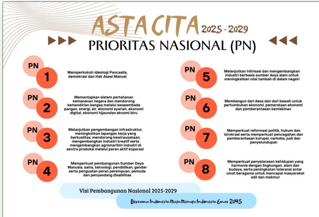
Gambar 4. Prioritas Nasional 2025-2029

Memperkuat penyalarsan kehidupan yang harmonis dengan lingkungan, alam dan budaya serta peningkatan toleransi antar umat beragama untuk mencapai masyarakat yang adil dan makmur.