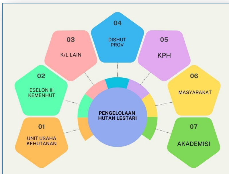
Gambar 7. Crosscutting pemangku kepentingan lingkup BPHL