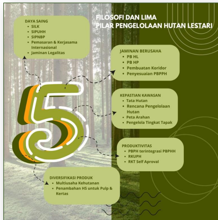
Gambar 5. Lima Pilar Pengelolaan Hutan Lestari