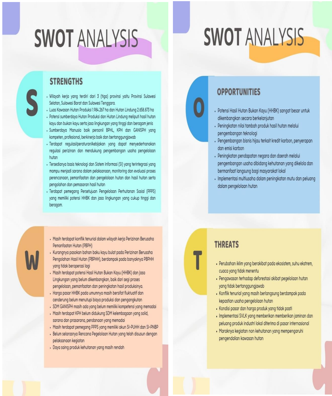
Matriks SWOT Pengelolaan Hutan Lestari

Direktorat Jenderal Pengelolaan Hutan Lestari telah mengidentifikasi faktor internal dan eksternal yang menghasilkan analisis strategis dalam bentuk matriks SWOT sehingga dapat membantu pengambilan langkah-langkah strategis pengelolaan hutan lestari. Matriks SWOT pengelolaan hutan lestari dapat dilihat pada Gambar 1.