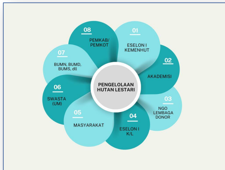
Gambar 6. Crosscutting pemangku kepentingan lingkup Ditjen PHL

Pencapaian kinerja Ditjen PHL dalam upaya pengelolaan hutan tidak lepas dari peran serta dan kerjasama berbagai pemangku kepentingan dimulai dari pemerintah pusat lintas Eselon I Kementerian Kehutanan, lintas kementerian/Lembaga, pihak swasta (unit manajemen), NGO Lembaga Donor, akademisi, sampai dengan masyarakat. Pada lingkup BPHL Wilayah XV juga terbentuk crosscutting berbagai pihak seperti Es. III lingkup Kemenhut, Kementerian/Lembaga lain, Pemerintah Provinsi (Dinas Kehutanan Provinsi dan KPH), pihak swasta, unit usaha kehutanan dan masyarakat. Gambaran crosscutting dalam lingkup Ditjen PHL dapat dilihat pada Gambar 6 dan Tabel 6 berikut.